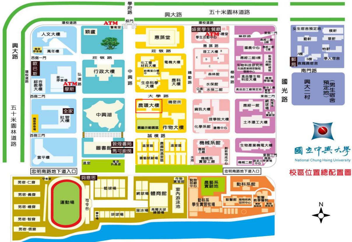
校區位置總配置圖