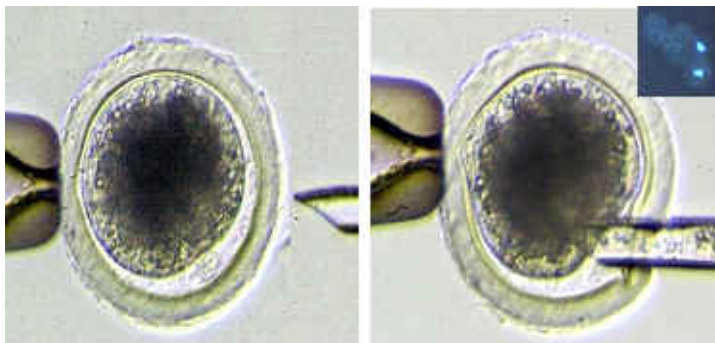
受核卵母細胞去核