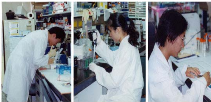
基因轉殖動物分析：PCR、Western blot、IHC stain